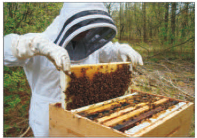
चित्र 12.2 (अ) मधुमक्खी पालन

मधुमक्खी पालन कृत्रिम मधुमक्खी छत्ते में जो एक लकड़ी के बक्सेनुमा संरचना होती है, में किया जाता है जिसका एक हिस्सा दरवाजे के समान खुलने एवं बन्द करने वाला होता है। यह बक्सा दो भागों में बाँटा रहता है। ऊपरी भाग 1/4 होता है,