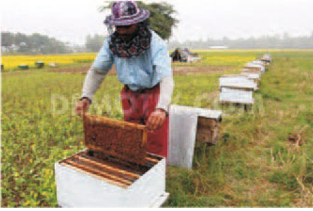
चित्र 12.2 (ब) मधुमक्खी पालन

जो शहद का खण्ड कहलाता है। नीचे का 3/4 भाग शिशुओं का खण्ड होता है।