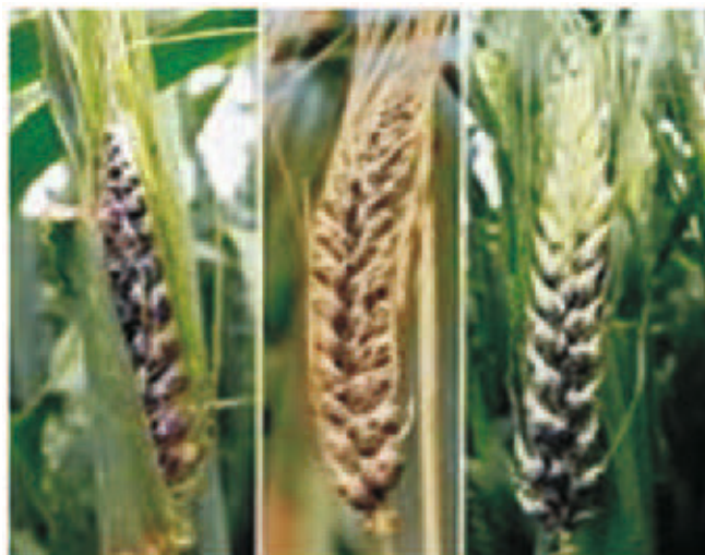
चित्र-7.5 जौ का आवृत कण्ड

ये कण्ड पुंज पतली मजबूत झिल्ली (Silvery membrane) एवं तुषों के अवशेष से ढके रहते हैं, इसलिए इन्हें