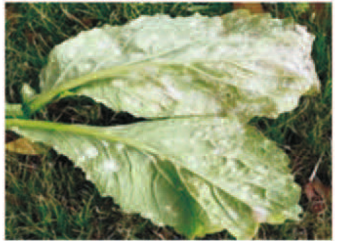
चित्र— 7.6 (1) सफेद रोली से संक्रमित पत्ती

1. स्थानीय संक्रमण — इस प्रकार के संक्रमण में पौधों की पत्तियों, तनों, पुष्प वृंतों पर चमकीले सफेद से क्रीमी रंग के उभरे हुए फफोले सदृश स्फोट बनते हैं। इनका आकार एक से दो मिलीमीटर तक हो सकता है। पत्तियों पर बनने वाले स्फोट आपस में संलयित होकर बड़े-बड़े स्फोट में परिवर्तित हो जाते हैं। प्रारम्भिक अवस्था में स्फोट पत्ती की निचली सतह पर बनते हैं परन्तु उग्र अवस्था में ऊपरी सतह पर भी बनने लगते हैं व बाह्य त्वचा के फटने से बीजाणु धानी पुंज सफेद चूर्ण (Sporangia) दिखाई देने लगते हैं।