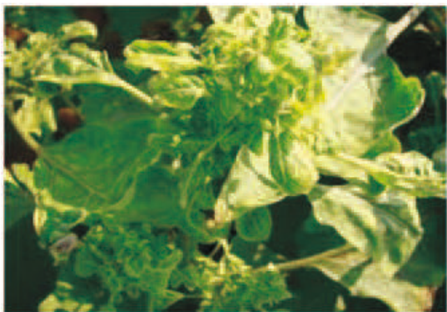
चित्र- 7.7 बैंगन का लघुपर्ण रोग

प्रायः संक्रमित पौधों पर पुष्प नहीं बनते और यदि बनते भी हैं तो हरे रह जाते हैं। फल प्रायः नहीं बनते हैं और जब बनते हैं तो आकार में छोटे एवं कठोर होते हैं।