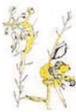
चित्र – 7.6 (2) महामृग शीर्ष (Stage head)

अतिवृद्धि या कुरुपित होकर महामृग शीर्ष (stag head) को बना देते हैं तथा बंध्य हो जाते हैं। पुष्पांग फूले हुए मांसल हरे या बैंगनी रंग के हो जाते हैं। पंखुडियाँ बाह्य दल के समान हरे रंग की पुंकेसर पत्ती के समान या कभी-कभी स्त्रीकेसर के समान विरूपित हो जाते हैं। कभी-कभी पुंकेसर फूलकर मुद्गर जैसी आकृति के और अण्डाशय फूलकर मांसल हो जाता है। पराग कण एवं बीजाण्ड के शीर्ण या अपश्य होने के कारण बीज नहीं बनते हैं। स्वस्थ सुषुप्त कलियाँ उद्दीप्त होकर पार्श्वी शाखाओं के रूप में विकसित हो जाते हैं। वर्षा होने पर रोगी पौधे सड़ जाते हैं परन्तु शुष्क अवस्था में मृगशीर्ष (Stage head) शुष्क खड़े होकर ऎठन भरे दिखाई देते हैं।