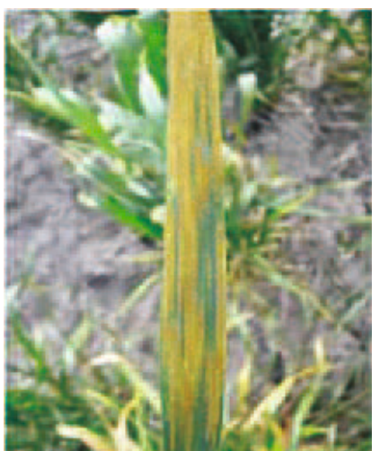
चित्र 7.3 गेहूँ पर पीले किट्ट का प्रभाव

उग्र अवस्था में स्फोट पर्णाच्छद, बाह्य पुष्प कवच, वृंत दोनों ओर डंठल पर भी बन जाते हैं, जिन स्थानों पर स्फोट, पंक्तियों में बनते हैं, पत्ती का रंग हल्का हो जाता है। यूरैडियम की बाह्य त्वचा फटने पर यूरैडोबीजाणु वातावरण में बिखर जाते हैं।