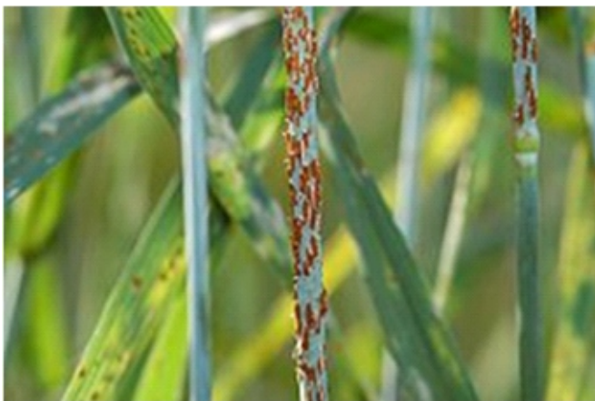
चित्र- 7.1 गेहूँ के पौधे पर स्तम्भ किट्ट के लक्षण

ये स्फोट यूरिडिनियम होते हैं और इनको ढकने वाली झिल्ली के नष्ट होने या फटने पर भूरे रंग के