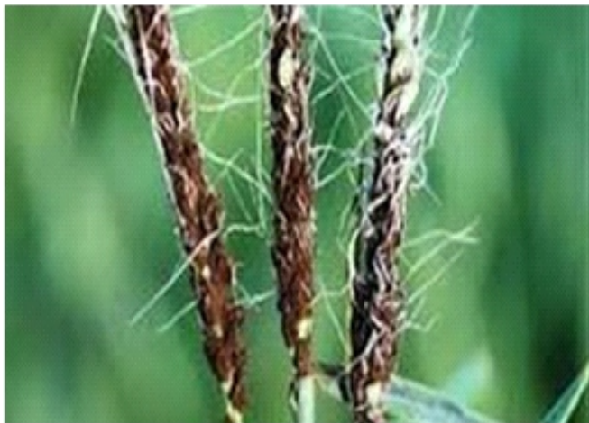
चित्र 7.4 – गेहूँ का अनावृत कण्ड

अण्डाकार आकृति के होते हैं। इसके उपर छोटे- छोटे काँटे जैसी संरचनाएं पायी जाती हैं। प्रत्येक बीजाणु चार कोशिकीय प्राकृतंतु बनाकर अंकुरित होता है, जिसकी प्रत्येक कोशिका से एक संक्रमण सूत्र (Infection thread) निकलता है। दो संक्रमण सूत्र मिल कर द्विकेन्द्रकीय संक्रमण सूत्र का निर्माण करते हैं जो वृत्तिकाग्र को भेदकर भ्रूण तक पहुँच जाते हैं और निष्क्रिय अवस्था में बनी रहती हैं।