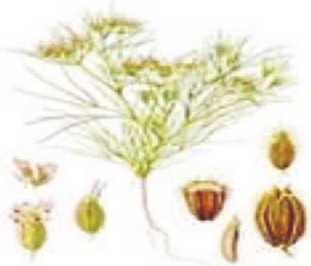
चित्र – 7.8 जीरे का म्लानि रोग

यदि पौधे पुष्पन अवस्था में संक्रमित होते हैं तो बीज नहीं बनते हैं और यदि बनते हैं तो पतले, छोटे, सिकुड़े हुए रह जाते हैं।